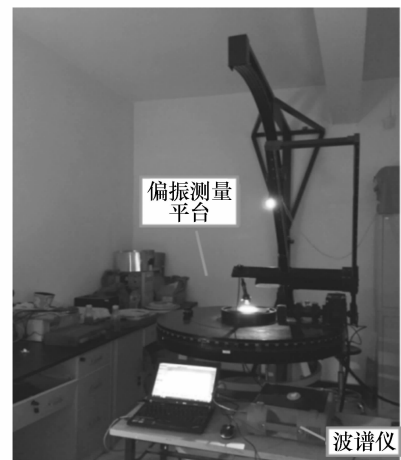
图1 多角度偏振测量平台

实验仪器采用东北师范大学偏振测量重点实验室的多角度测量平台 [17] ,由长春光机所和东北师范大学合作研制,该仪器可以用来测量目标的双向反射特性和偏振反射特性。仪器由光源系统、控制系统以及探测系统三部分组成。光源是卤钨灯,利用ASD FieldSpec 3波谱仪测定反射光的强度值,光谱仪的有效波段范围是350~2500 nm,波谱仪的光纤镜头前配有偏振棱镜,在镜头前配置不同方向的偏振片,即可测出相应方向的偏振光强。图1为实验仪器图。